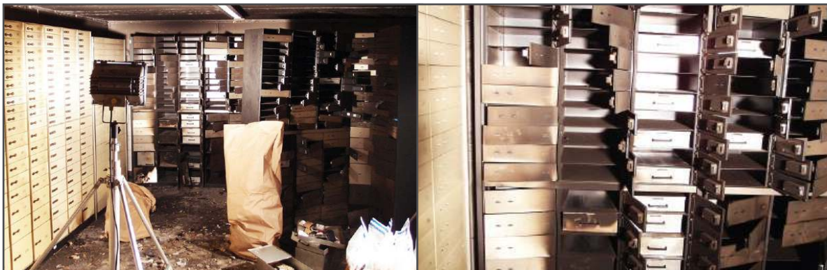
Tresorraum Volksbank Berlin-Steglitz nach Banküberfall, Jan 2013; Quelle: dpa

Ein weiterer Aspekt: Wenn Diebe Kundenschließfächer in einer Bank ausräumen, so ist der Inhalt nicht automatisch versichert. Das gleiche gilt auch dann, wenn die Schließfächer durch Feuer zerstört werden. Es bietet sich daher an, spezielle Versicherungen abzuschließen, die jedoch in der Regel recht teuer sind, wobei vor Augen gehalten werden sollte, dass der Kunde in der Beweispflicht steht, dass das Schließfach vor einem Diebstahl oder Feuer auch tatsächlich mit den angegebenen Waren gefüllt war und nicht zufällig vom Kunden selber leergeäumt wurde. Es ist gerade diese Beweispflicht des Kunden, die die Versicherung meist ausnutzen und Kunden trotz abgeschlossener Versicherung mit leeren Händen dastehen lassen. Oft bleiben Kunden auf ihrem Schaden sitzen. Siehe Bankraub Volksbank Berlin-Steglitz im Januar 2013, bei dem die Kunden nach einem Jahr immer noch auf eine Entschädigung warten und im Januar 2014 sogar öffentlich demonstriert hatten.