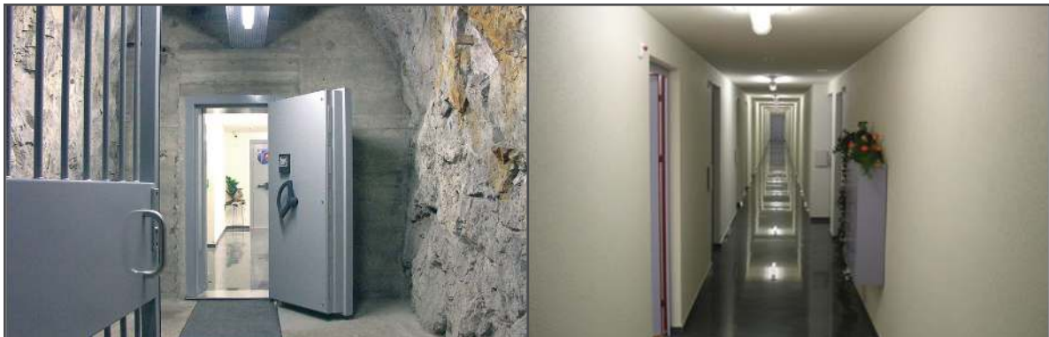
Hochsicherheitslager mit höchster Sicherheitsstufe Europas

Die Elementum bietet all dies an, denn Elementum wurde ins Leben gerufen, damit Silber (und natürlich auch Gold) effektiv und sicher gelagert und gehandelt werden kann.