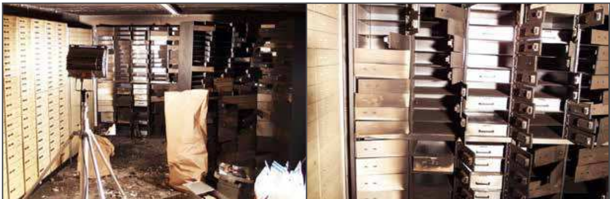
Tresorraum Volksbank Berlin-Steglitz nach Banküberfall, Jan 2013

Ein weiterer Aspekt: Wenn Diebe Kundenschließfächer in einer Bank ausräumen, so ist der Inhalt nicht automatisch versichert. Das gleiche gilt auch dann, wenn die Schließfächer durch Feuer zerstört werden. Es bietet sich daher an, spezielle Versicherungen abzuschließen, die jedoch in der Regel recht teuer sind, wobei vor Augen gehalten werden sollte, dass der Kunde in der Beweispflicht steht, dass das Schließfach vor einem Diebstahl oder Feuer auch tatsächlich mit den angegebenen Waren gefüllt war und nicht zufällig vom Kunden selber leergeäumt wurde. Es ist gerade diese Beweispflicht des Kunden, die die Versicherung meist ausnutzen und Kunden trotz abgeschlossener Versicherung mit leeren Händen dastehen lassen. Oft bleiben Kunden auf ihrem Schaden sitzen. Siehe Bankraub Volksbank Berlin-Steglitz im Januar 2013, bei dem die Kunden nach einem Jahr immer noch auf eine Entschädigung warten und im Januar 2014 sogar öffentlich demonstriert hatten.