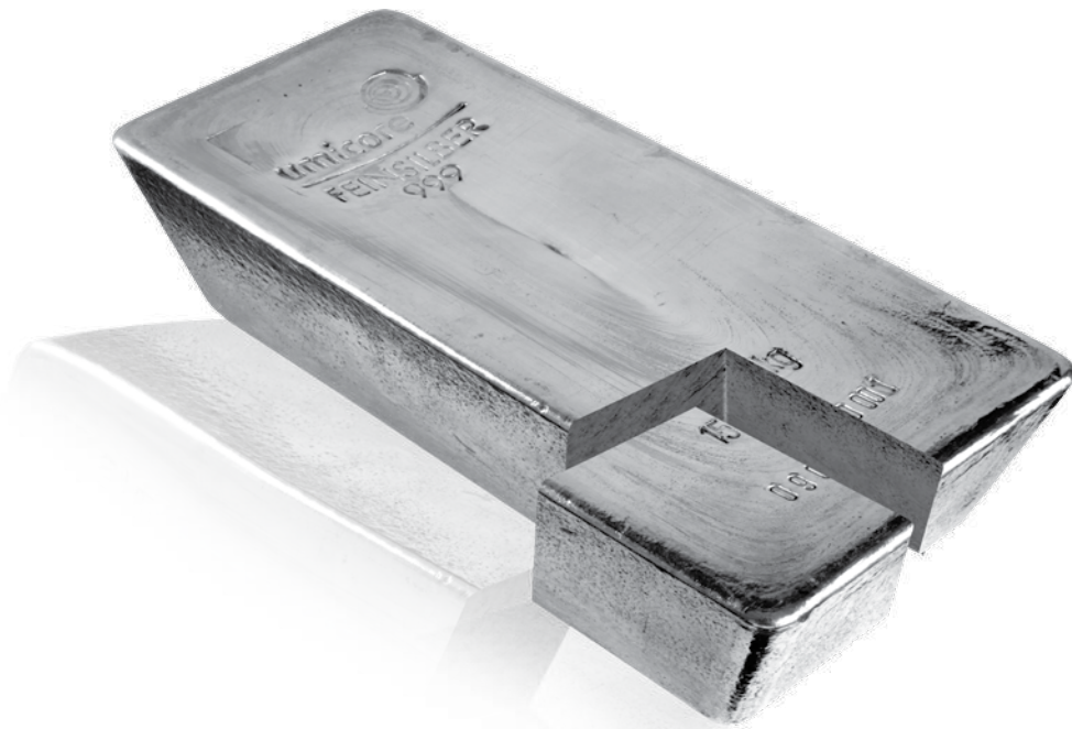
15 kg Silberbarren