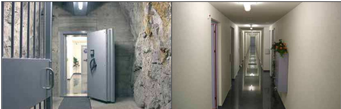
Hochsicherheitslager mit höchster Sicherheitsstufe Europas, Quelle: Elementum

Die Elementum bietet all dies an, denn Elementum wurde ins Leben gerufen, damit Silber (und natürlich auch Gold) effektiv und sicher gelagert und gehandelt werden kann.